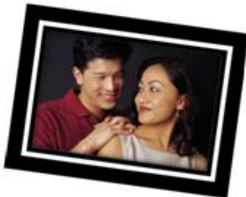
Figura 4: Fotos con distintos estilos de marcos.